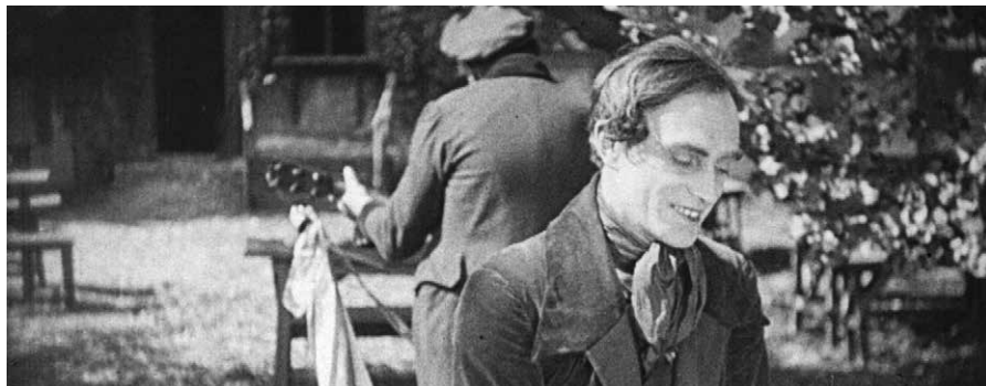
o estudante de praga

Um dos clássicos do cinema expressionista, O Estudante de Praga aborda o tema do doppelgänger. Balduin é um jovem estudante e exímio esgrimista que, humilhado pela sua pobreza, aceita vender o reflexo a um bruxo. A realização de Henrik Galeen é prodigiosa e uma súpula do cinema alemão da época, com sombras, sobreposições, câmara subjetiva, iris, claro-escuro, numa poderosa e impressionante composição visual.